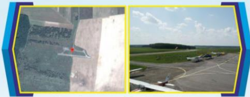
Аеродром сільськогосподарської авіації